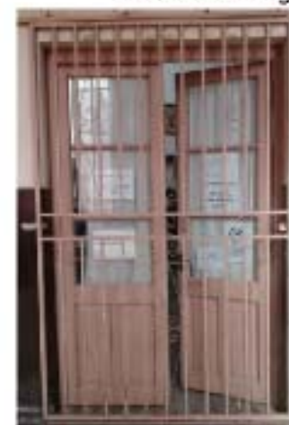
CC1 puerta biblioteca