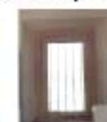
CC1 ventana baños