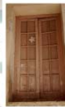
CC1 Ventana aulas 1 y 10