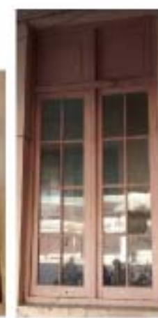
CC1 Ventana escalera