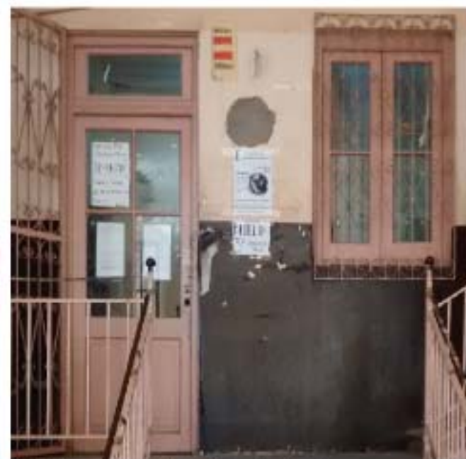
CC2 Puerta ventana Administracion