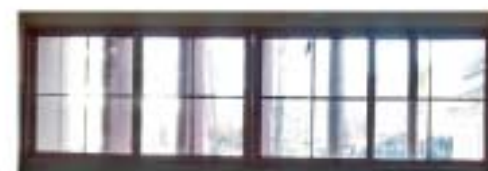
CC1 Ventana galerias (metalicas)