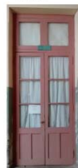
CC1 Puerta aulas