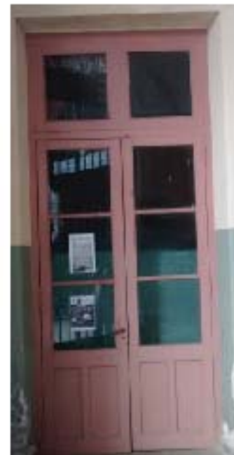
CC1 Puerta hall de Entrada