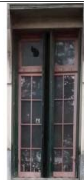
CC1 Ventana aulas c/celocias