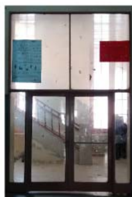
CC1 Puerta hall principal