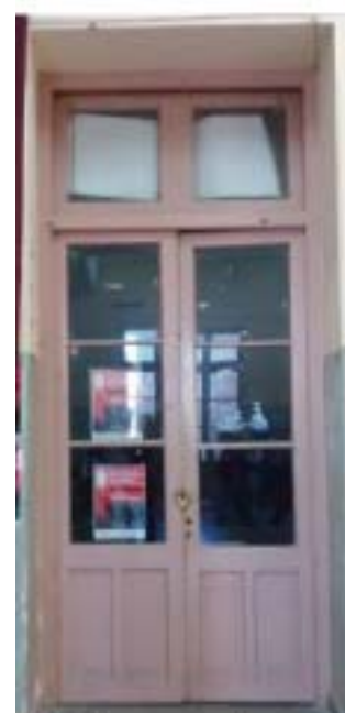
CC1 Puerta auditorio