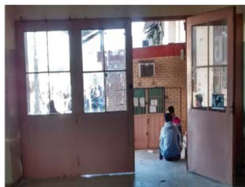
CC1 Puerta galeria a patios (metalica)