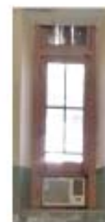
CC1 Ventana Preceptoría