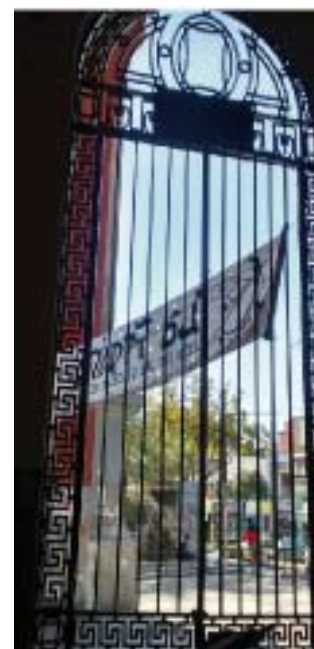
CC1 Reja de entrada