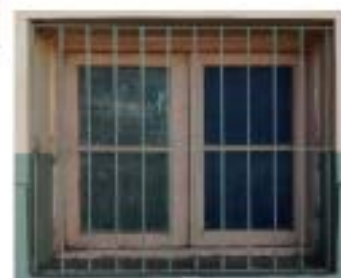
CC3 ventana infrmatica