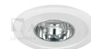
FENIX SERIE 35046